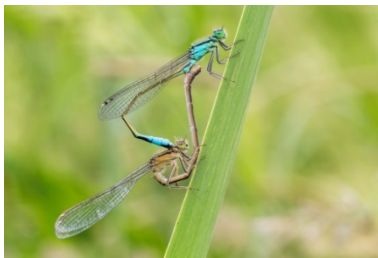
Libellen können mit Anglern am Wasser ko-existieren.