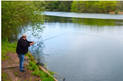
Angler am Baggersee: Verkannte Naturschützer.