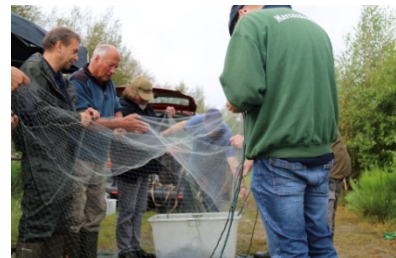
Beim Forschungseinsatz: Angler begleiten die Forschenden bei der Feldarbeit und besuchen deren Seminare.