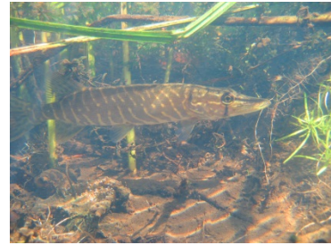
Hechte und andere heimische Raubfische profitieren von der anglerischen Bewirtschaftung.