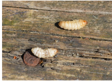
Liegegebliebene Maden: Oft nicht die einzigen Angelrückstände am See.